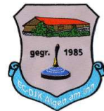
EC DJK Aigen a. Inn