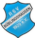
RSV 1929 Büblingshausen